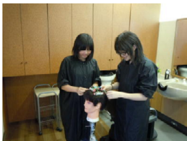
<サロンド・ウイング 新宮苑>

また今日(5月24日)は五日市高等学校の校長先生に来校していただき、1年生と共に講話をしてもらいました。これについてもじっくり聞いてくれました。